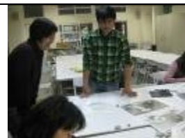
志工成長班-畫畫班