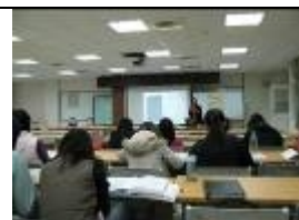
特教知能研習剪影