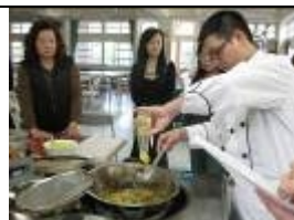
志工成長班-烹飪班