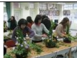
志工成長班-插花班