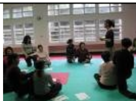
志工成長班-筋絡拳

➤建立社會福利支援網路：新北市政府教育局、新北市政府社會局、新北市家庭暴力暨性侵害防治中心、板橋區公所、中和區公所、板橋社服中心、新北市家扶中心。