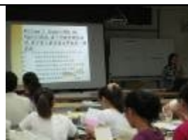
輔導知能研習剪影